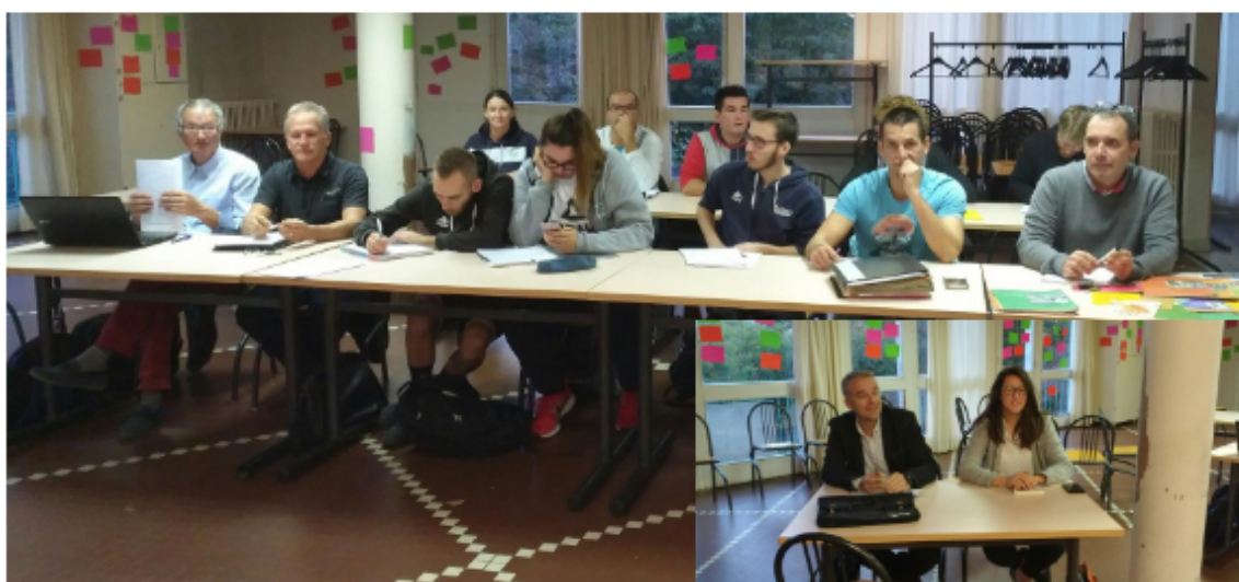
Ils sont studieux tous les deux !

Toute l'équipe des écoles d'arbitrage souhaite à tous les formateurs plein de réussite et nous les remercions pour l'engagement auprès des écoles d'arbitrage !